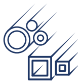
Rund-/Vierkantrohre und Stangen