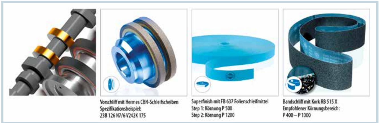
4 Hermes-Lösung für die Schleif- und Finishbearbeitung von Nockenwellen mit Schleifolie oder im CAB-Verfahren

CBN-Werkzeuge wirtschaftlich sein; dann ist immer eine bedarfsgerechte Werkzeugauslegung erforderlich. Progressive Schleifmittelhersteller berücksichtigen das, indem sie stets individuelle Werkzeuge gemäß der Schleifaufgaben ihrer Kunden fertigen.